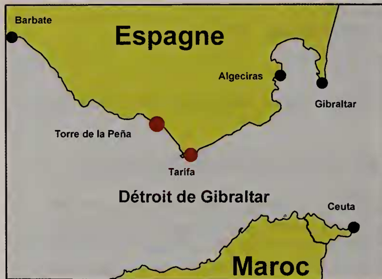
Figure 1. Détroit de Gibraltar et environs

vides (Fig. 3C et 3D) ou pleines (Fig. 3A et 3B) ont été isolées, les unes libres (Fig. 3B et 3D), les autres (Fig. 3A et 3C) fixées sur des fragments d'algues calcaires articulées, les corallines (Lamarre & Dupré 2014). Les capsules pleines contenaient chacune un seul individu juvénile (Fig. 3A et 3B) avec l'apex orienté à chaque fois vers la base de la capsule. L'une d'elle a été disséquée et la protoconque isolée a été préservée (Fig. 3E).